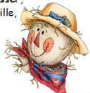
Illustration: M. J. L.

Les cheveux en bataille Le corps en brin de paille Vêtu d'un vieux chandail, C'est l'épouvantail. Il fait peur aux moineaux Aux corneilles, aux corbeaux, À tout oiseau qui piaille, C'est l'épouvantail. Est-ce que tu oserais Le toucher, l'embrasser, Le prendre par la taille, Cet épouvantail ?