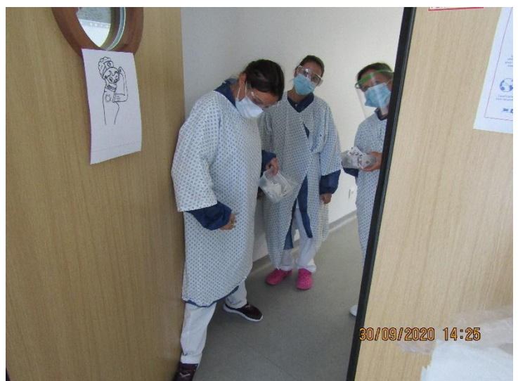
L'équipe dédiée à l'unité COVID a fait un travail remarquable !