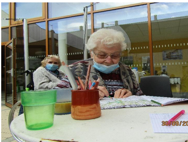
Séance de coloriage en extérieur, entre deux averses !