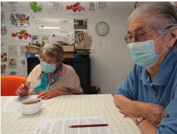
L'Atelier Mémoire, à chacun son rythme