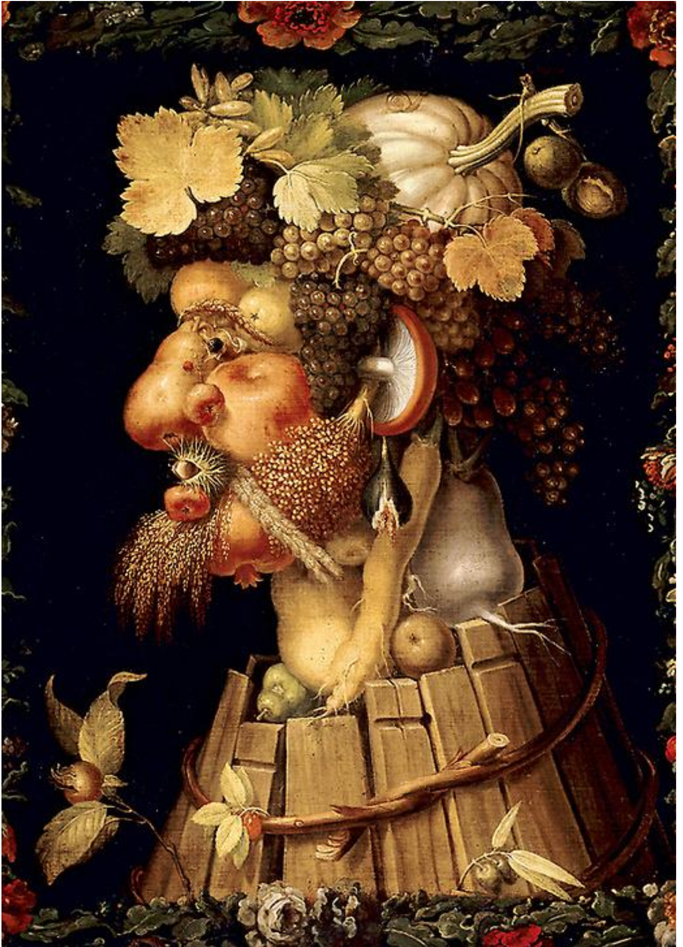
L'Automne de ARCIMBOLDO Giuseppe